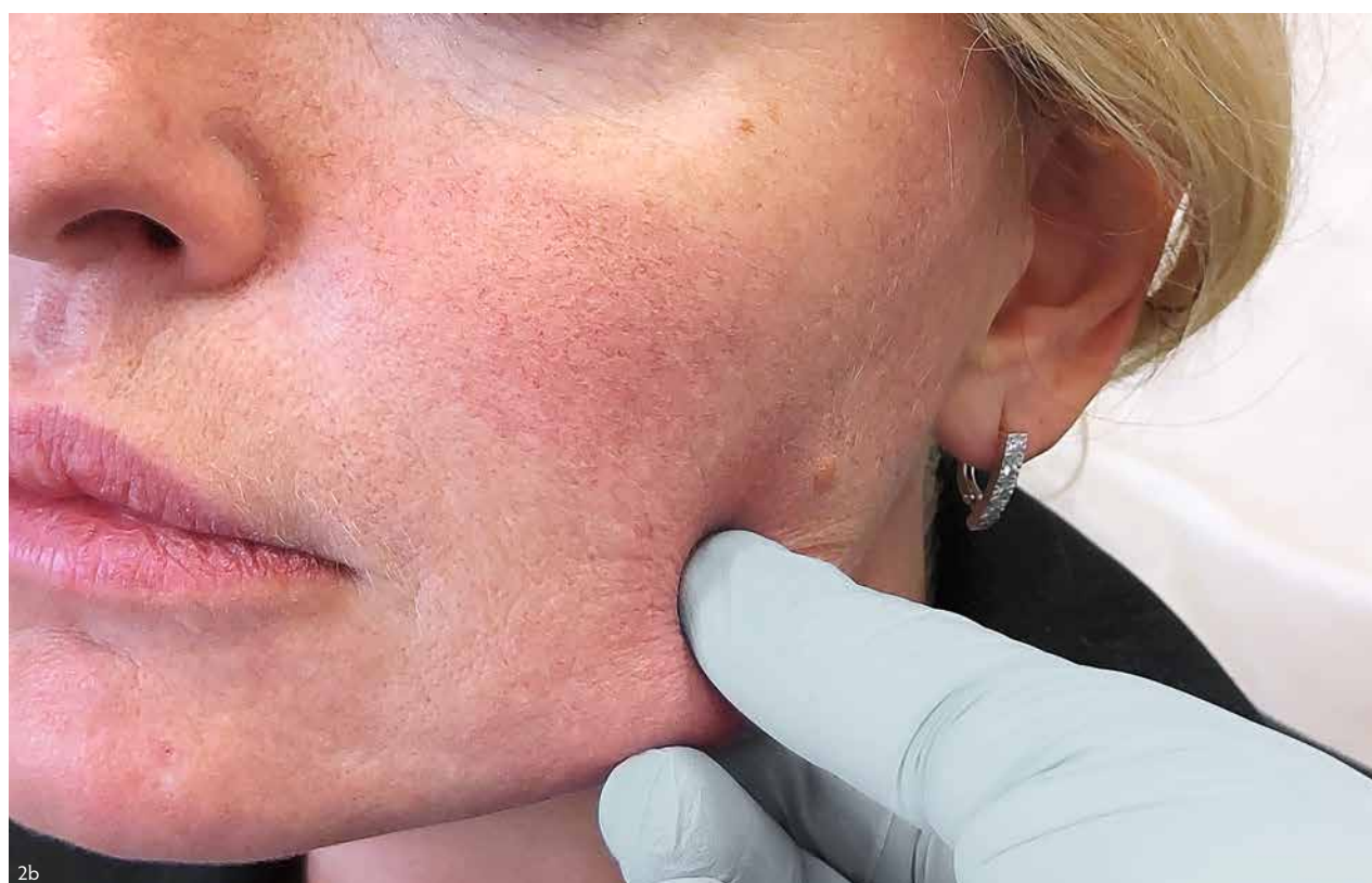
Фото 2. Пациент — женщина, 45 лет. А — до процедуры, Б — через 56 дней